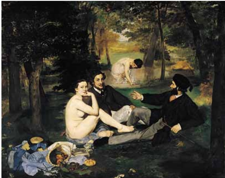
DÉJEUNER SUR L'HERBE Manet