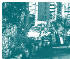
Guerilla gardening of bloemen, planten en ander groen zomaar laten opduiken in het stadsbeeld.