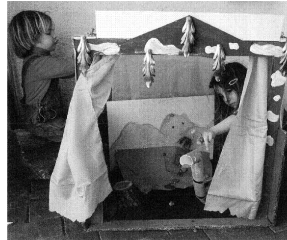
Deze kinderen testten SPEEL*GOED alvast uit, met succes én pret verzekerd! http://www.youtube.com/watch?v=70W0Yqvg4KU

Wens je een workshop rond SPEEL*GOED te organiseren? Het Forum voor Amateurkunsten heeft verschillende formats ontwikkeld voor scholen, verenigingen, gezinnen... Kijk en reserveer op www.amateurkunsten.be