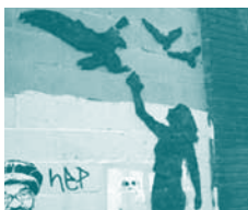
Groene graffiti of het 'be-kladden' van openbare ruimtes, gebouwen met mos