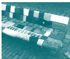
Wildbreien geeft meer kleur aan de stad.

Let wel, kunst in openbare ruimtes loopt het risico om beschadigd te worden door natuurlijke factoren zoals wind en regen, of door vandalisme of diefstal. Vele kunstenaars lossen dit op door hun werk vast te leggen op de gevoelige plaat of filmrol en dit te gebruiken als expositiemateriaal. Anderzijds kan beschadiging zoals afbrokkeling of afschilfering net heel mooi zijn. Het zet de symbiose tussen kunst en natuur extra in de verf.