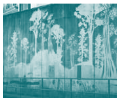
Kunst met hogedrukreiniger waarbij de tekening proper gespoten wordt en uit het vuile oppervlak springt.