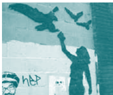
Groene graffiti of het 'be-kladden' van openbare ruimtes, gebouwen met mos