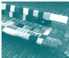
Wildbreien geeft meer kleur aan de stad.

Let wel, kunst in openbare ruimtes loopt het risico om beschadigd te worden door natuurlijke factoren zoals wind en regen, of door vandalisme of diefstal. Vele kunstenaars lossen dit op door hun werk vast te leggen op de gevoelige plaat of filmrol en dit te gebruiken als expositiemateriaal. Anderzijds kan beschadiging zoals afbrokkeling of afschilfering net heel mooi zijn. Het zet de symbiose tussen kunst en natuur extra in de verf.