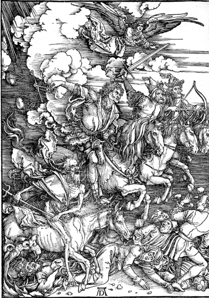
DIE VIER APOKALYPTISCHEN REITER Albrecht Dürer