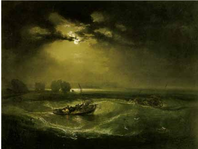
VISSERS OP ZEE William Turner

En zo zijn er nog veel andere kunstenaars die ongetwijfeld ‘instant inspiratie’ bieden. Je kan hen allen terugvinden via google , youtube of in de bibliotheek. Hieronder een korte, allesbehalve volledige, opsomming die je gerust verder kan aanvullen.