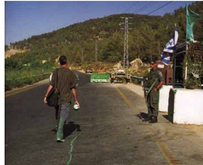
THE GREEN LINE Alÿs

Hierbij denken we meteen aan Banksy, Jeff Koons, Paul McCarthy, Santiago Sierra... maar ook aan schrijvers zoals Louis Paul Boon, Michel Houellebecq, Gabriël Garcia Marquez, Voltaire en Antoine de Saint-Exupéry met De kleine prins ... Er zijn uiteraard veel maatschappijkritische regisseurs zoals Michael Moore, Lars Von Trier, Ken Loach,... en vergeet animatiereeksen The Simpsons en Southpark niet. Ook fotografen geven vaak een statement via hun foto's. Denk maar aan Oliviero Toscani, beroemd door zijn foto's voor Benetton. En dan is er de muziek. Heel veel muzikanten leveren kritiek op mens en maatschappij, denk maar aan Bruce Springsteen (the Boss), Boudewijn De Groot, John Lennon, Doe maar, The Sex Pistols, Joan Baez, Bob Dylan, en nog zoveel meer.