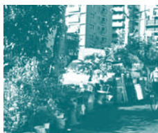
Guerilla gardening of bloemen, planten en ander groen zomaar laten opduiken in het stadsbeeld.