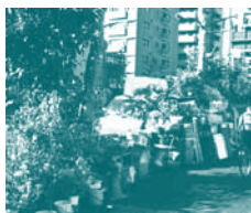
Guerilla gardening of bloemen, planten en ander groen zomaar laten opduiken in het stadsbeeld.